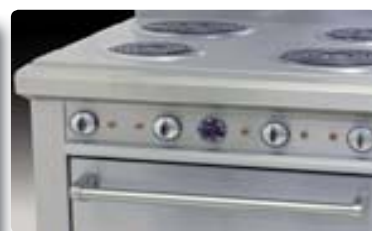
Estufa Eléctrica EC-4-HM-E