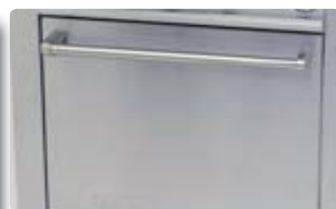
Estufa Eléctrica EC-6-HG-E