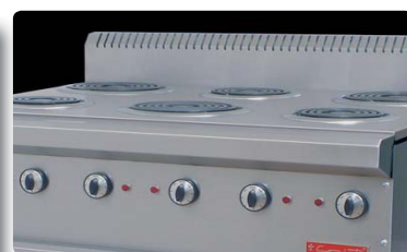
Estufa Eléctrica PC-6-E