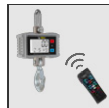
Opción de operación a distancia por control remoto (BAC-500)