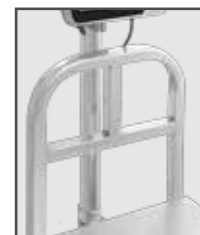
Barandal de carga en BAPAG-200