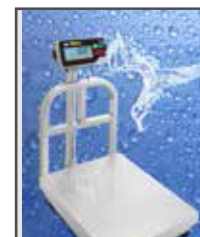
A prueba de agua, útil en cuartos fríos