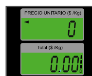
Pantallas de cuarzo con iluminación (backlight)