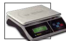
Incluye mica protectora