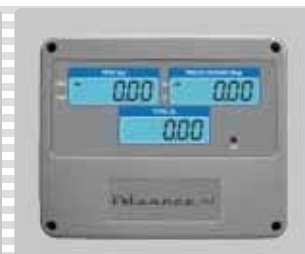
Pantallas de cuarzo con iluminación

Av. La Paz No. 913 Col. Centro, Guadalajara, Jal. (33) 33450650