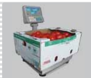
Plato de gran capacidad