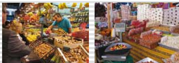
100% Portátil, opera sin necesidad de cables