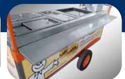
REPISA DE SERVICIO

Gabinete con cubierta de Acero Inoxidable