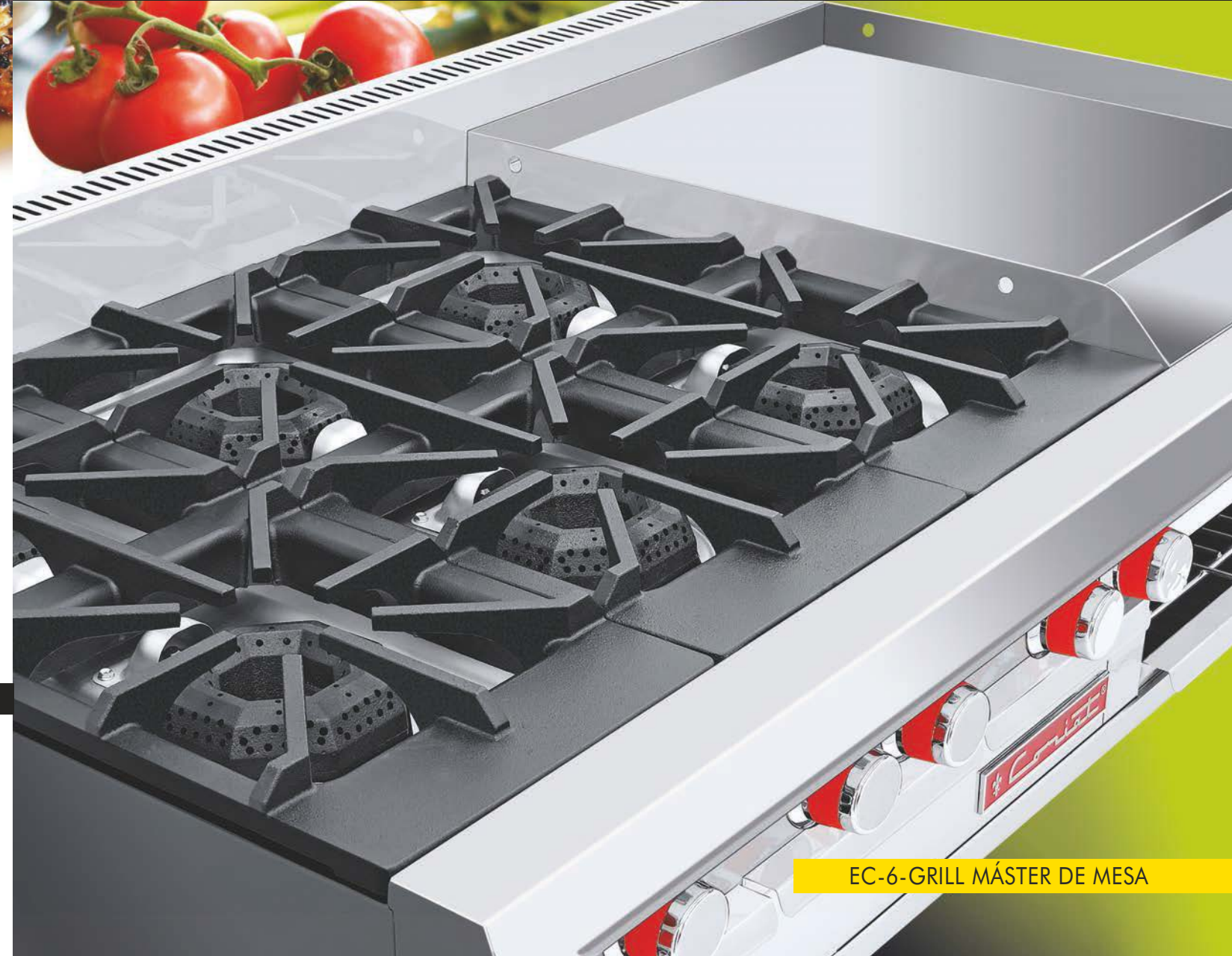
EC-6-GRILL MÁSTER DE MESA