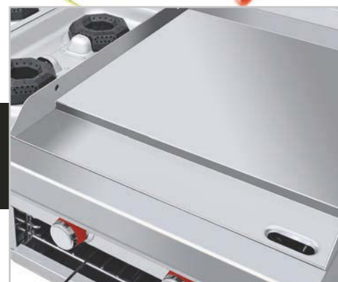
Plancha con exclusivo sistema para recolectar grasa y residuos.