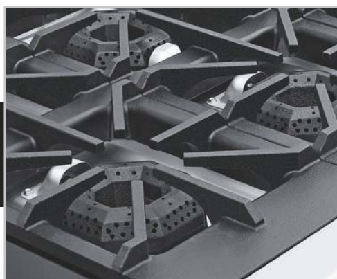
Robustas parrillas súper resistentes desmontables, facilitan la limpieza.