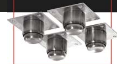
OPCIONAL: Base estructural o Kit de patas tubulares.