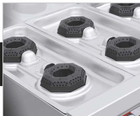
Cubierta semi-sellada, evita escurrimientos al interior.