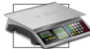
Incluye mica protectora