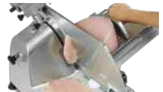
Cuchilla fabricada en Italia

SERVICIO Y REFACCIONES DISPONIBLES Contamos con una red de centros de servicio en toda la república: rhino.mx/servicio.html