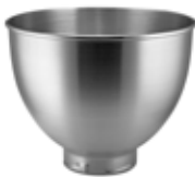
RECIPIENTE ACERO INOXIDABLE 4.5-QUART