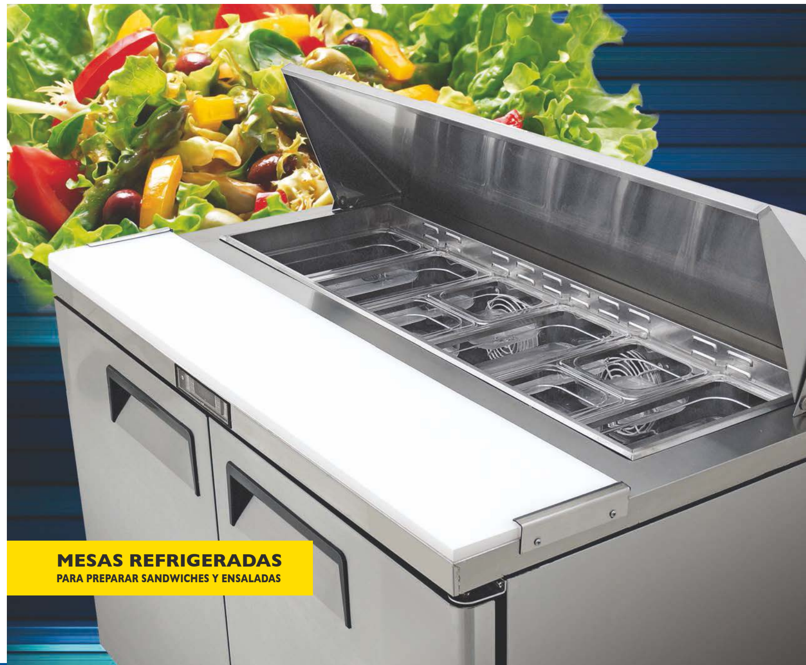
MESAS REFRIGERADAS PARA PREPARAR SANDWICHES Y ENSALADAS