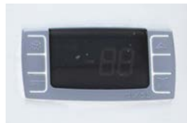
• Control digital de temperatura.