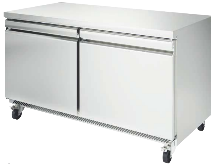
UC 60 R