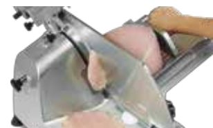
Cuchilla fabricada en Italia

SERVICIO Y REFACCIONES DISPONIBLES Contamos con una red de centros de servicio en toda la república: rhino.mx/servicio.html