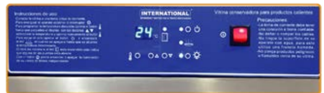
Indicador y sensor de temperatura.