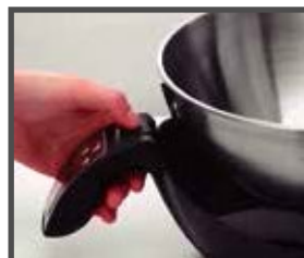
Tazón desmontable para facilitar su limpieza