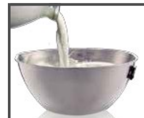
Tazón de acero inoxidable con graduación