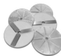
Incluye 5 discos de corte intercambiables